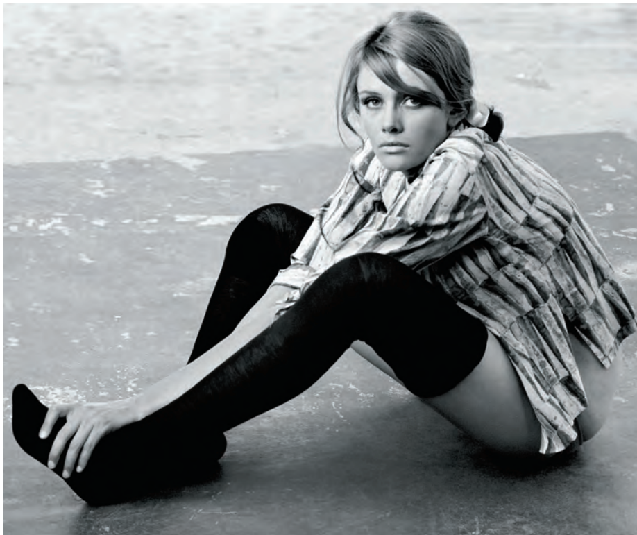
Das Bild «Black Stockings» von Haskins stammt aus seinem ersten Fotoband «Five Girls» (1962).

läuft es weiter. Aber in diesem Ausmass... nein. Ich glaube, dass viele Leute bis dahin gut gelebt haben – sei es aus materiellen Gründen oder einfach, weil sie geografisch an vorteilhaften Orten geboren wurden. Diese Leute mussten auf einmal innehalten. Heute überlegen sie sich, wie gut sie es gehabt haben.